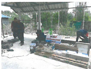
บมจ.ไทยเคนเปเปอร์ปราจีนบุรี SCGP สนับสนุนวัสดุอุปกรณ์