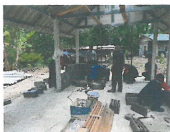
ผู้นำ ประชาชนในหมู่บ้าน