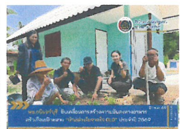
ปลูกพืชผักสวนครัว