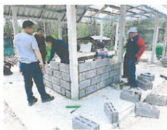
ภาพระหว่างดำเนินการ